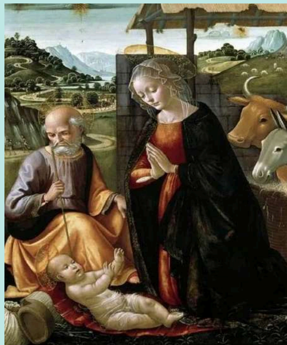
Domenico Ghirlandaio, Adorazione del Bambino (1492)