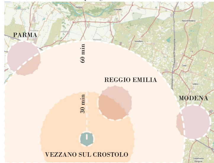
Sistema delle infrastrutture e distanze di percorrenza