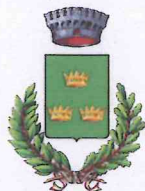
Comune di Albinea