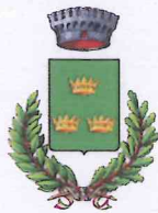
Comune di Albinea