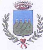
Comune di Quattro Castella