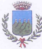
Comune di Quattro Castella