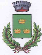
Comune di Albinea