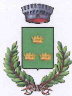
Comune di Albinea