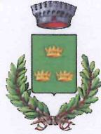
Comune di Albinea