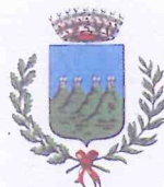
Comune di Quattro Castella