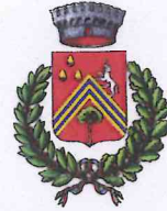
Comune di Vezzano sul Crostolo

dell'autorizzazione al subappalto o subcontratto, qualora dovessero essere comunicate dalla Prefettura, successivamente alla stipula del contratto o subcontratto, informazioni interdittive analoghe a quelle di cui all'art. 10 del D.P.R. 252/98, ovvero la sussistenza di ipotesi di collegamento formale e/o sostanziale o di accordi con altre imprese partecipanti alle procedure concorsuali d'interesse. Qualora il contratto sia stato stipulato nelle more dell'acquisizione delle informazioni del Prefetto, sarà applicata a carico dell'impresa, oggetto dell'informativa interdittiva successiva, anche una penale nella misura del 10% del valore del contratto ovvero, qualora lo stesso non sia determinato o determinabile, una penale pari al valore delle prestazioni al momento eseguite; le predette penali saranno applicate mediante automatica detrazione, da parte della stazione appaltante, del relativo importo dalle somme dovute all'impresa in relazione alla prima erogazione utile.