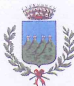
Comune di Quattro Castella