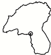
Tavola n°17 LA VECCHIA