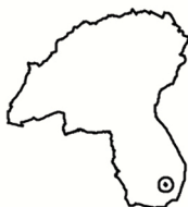
Tavola n°16 CAVAZZONE