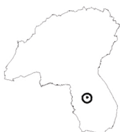
Tavola n°14 SCARZOLA