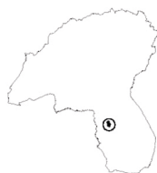
Tavola n°12 CA' DEI CAPRARI