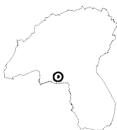
Tavola n°10 PADERNA