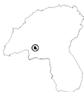
Tavola n°08 TRAVAGLIOLI