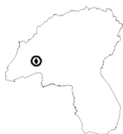
Tavola n°04 CASOLA