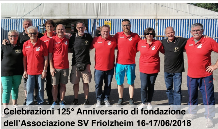
Visita Sindaco e Consigliere Frioilzheim 10/08/2018