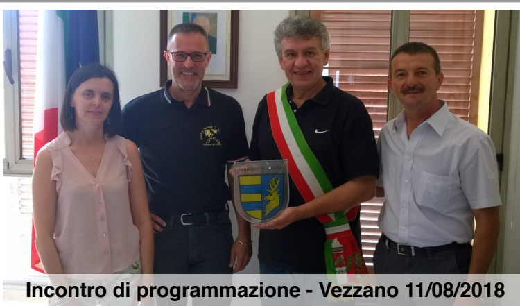
Incontro di programmazione - Vezzano 11/08/2018