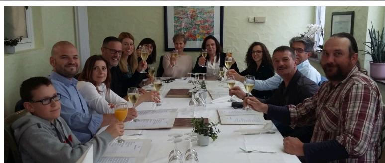
Cena con produttori vezzanesi - Frioilzheim 20/05/2018