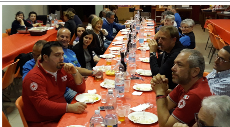
Cena italo-tedesca - Vezzano 5/05/2018