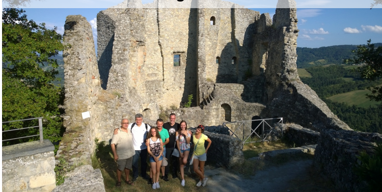
Visita Sindaco e Consigliere Frioilzheim 10/08/2018